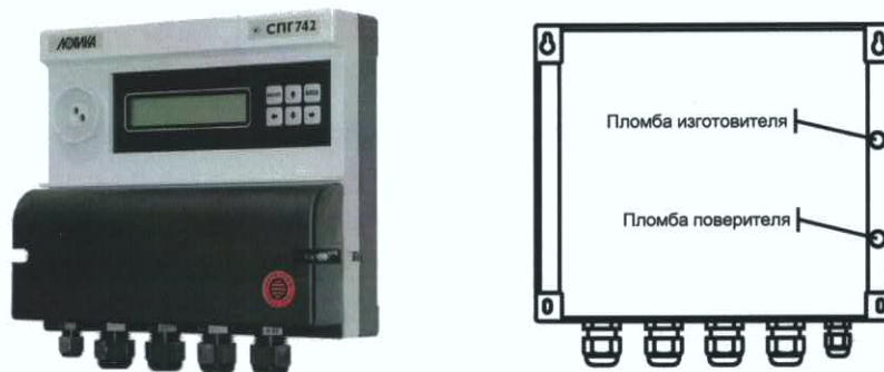
Рисунок 1 - Общий вид и схема пломбирования (вид сзади)

На лицевую панель корректора выведены клавиатура и дисплей, в монтажном отсеке корпуса размещена батарея, обеспечивающая автономное питание, и разъемы для внешних подключений. Доступ к элементам, расположенным внутри корпуса, в том числе, несущим программное обеспечение, ограничен пломбированием. Общий вид и схема пломбирования приведены на рисунке 1.